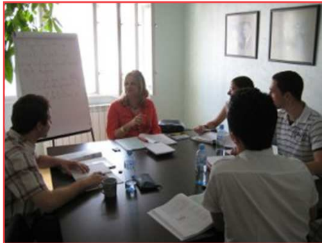
Kurs nemačkog jezika u Fondu