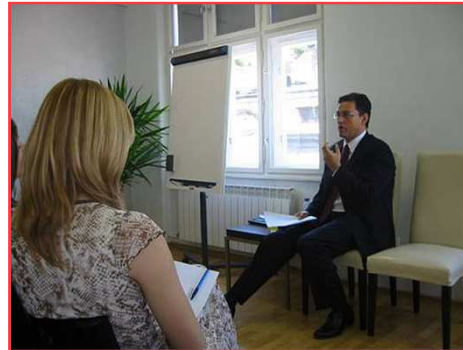
Pripremni seminar u Fondu