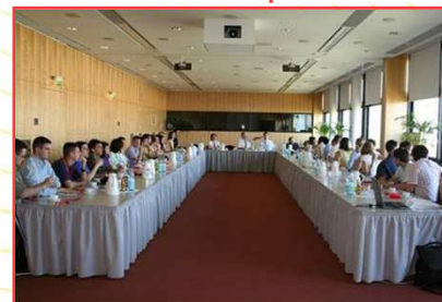
Pripremni program u Berlinu i prvi susret sa predstavnicima kompanija