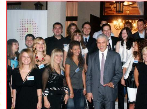
Prijem pre odlaska na prakse